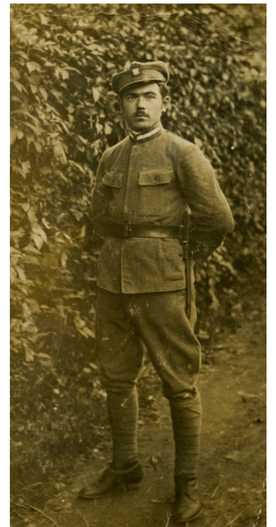
Příslušník čs. domobrany z Itálie