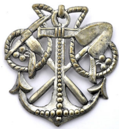
Rukávový rozlišovací odznak ženijního vojska dle předpisu z roku 1919 Soukromá sbírka