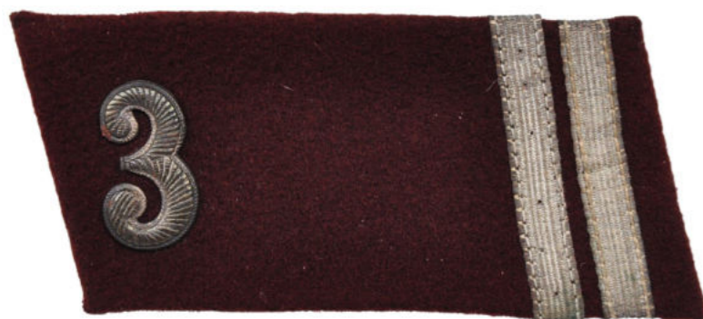
Výložka nadporučíka technických oddílů 3. pěšího pluku Soukromá sbírka