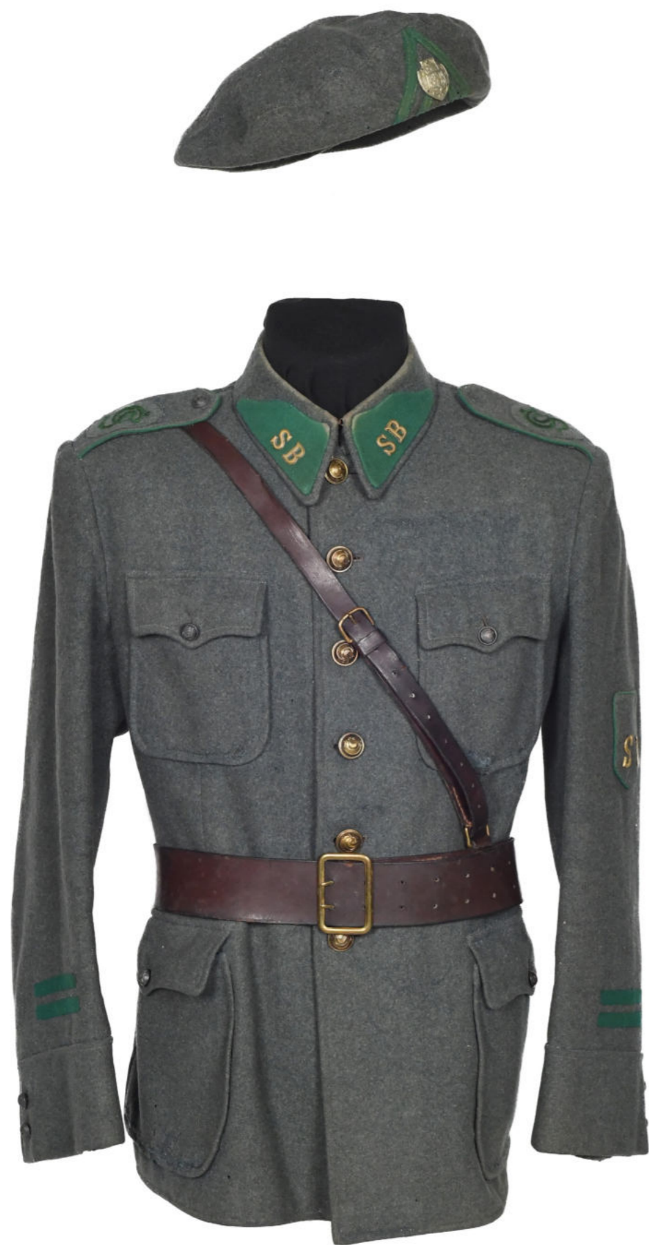
Blůza a baret čs. dobrovolce Slovácké brigády Soukromá sbírka