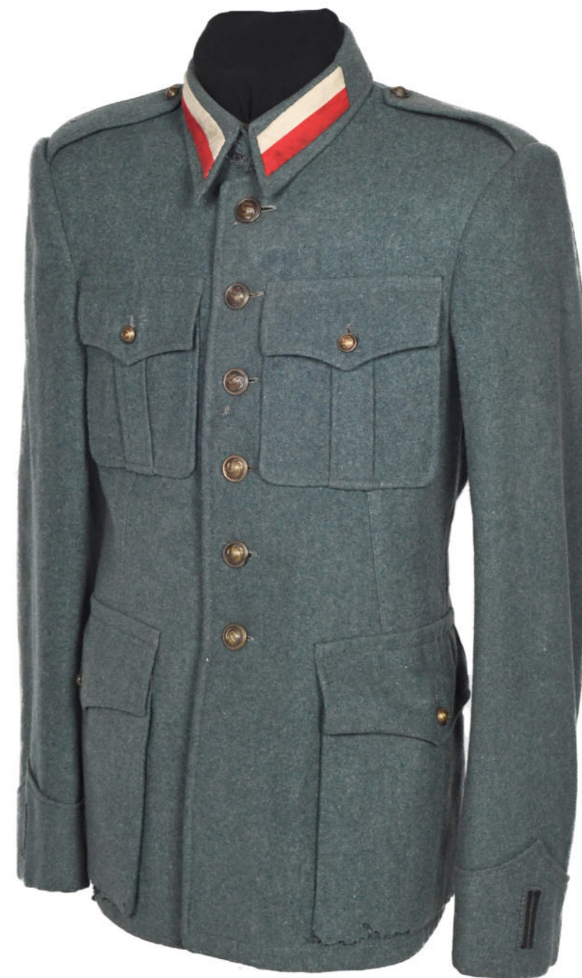
Blůza a čepice příslušníka 34. domobraneckého praporu z Itálie Sbírka VHÚ Praha