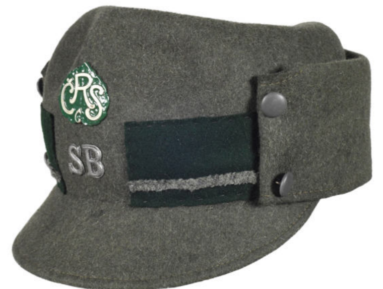
Plstěná polní čapka svobodníka Slovácké brigády

Slovácká brigáda se významně podílela na obsazování jihomoravského pohraničí, které usilovalo o odtržení od Československa, a jeho následné vojenské ochraně. Při obsazování samozvaného kraje Deutschesüdmähren došlo k mnohým střetům, ale Volkswehr, který se na Mikulovsku zformoval, nakonec území vyklidil. 148 Vojáci Slovácké brigády obsadili 30. listopadu 1918 Lednici a 16. prosince završili obsazování jihu Moravy získáním Mikulova a dalších pohraničních obcí.