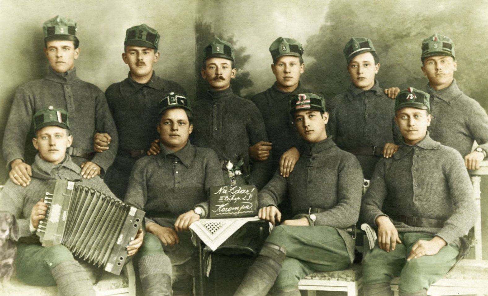
Ženíjný oddíl II. praporu 3. pěšího pluku Kolorovaná fotografie z pozůstalosti Jana Kubingera. Archiv autorů