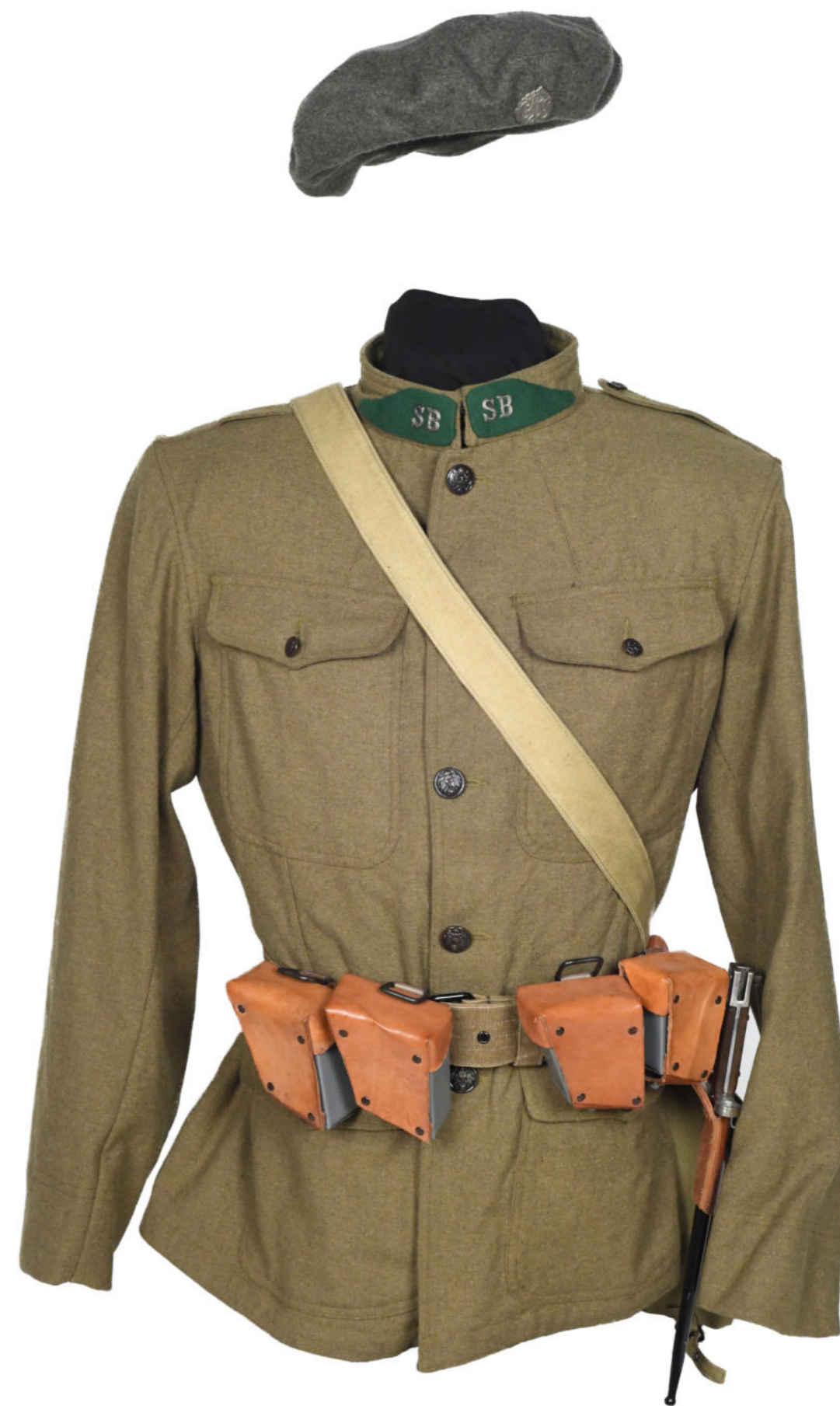
Americká blůza a baret příslušníka Slovácké brigády Soukromá sbírka